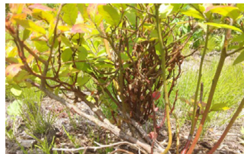
Balais de sorcière sur des plants de bleuets