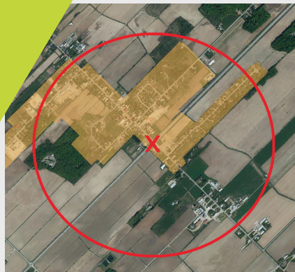
O : exemple d'un rayon de 800 mètres X : intersection de la route 158 et Grande Ligne Zone orange : périmètre urbain

Si nous avons à évacuer tous les résidents dans un rayon de 800 mètres carrés à l'intersection de la route 158 et de la Grande Ligne en raison d'un accident avec explosif, sauriez-vous comment réagir?